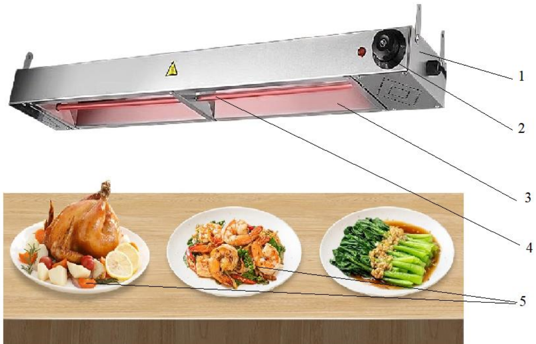
Рис. 1 – Марміт з інфрачервоним (ІЧ) нагрівом

На відміну від традиційних методів, які спочатку нагрівають повітря або поверхню, ІЧ-випромінювачі генерують хвилі, які поглинаються безпосередньо продуктом. Відбувається пряме нагрівання: хвилі проникають усередину страви, змушуючи молекули води та жиру вібрувати, що створює генерацію теплоти безпосередньо в продукті. ІЧ-промені можуть проникати в їжу на глибину до декількох сантиметрів (залежно від вмісту вологи), що забезпечує швидке та рівномірне прогрівання. Тепло фокусується там, де воно потрібне, не витрачаючи енергію на обігрів навколишнього середовища.