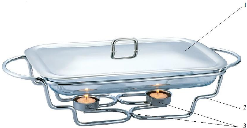
Рис. 3 – Марміт (чафіндіш) з сухим підігрівом 1 – гастроями, 2 – підставка, 3 – свічка.

На відміну від мармітів на водяній бані, у таких пристроях немає проміжного теплоносія (води). Повітря в камері нагрівається і передає тепло дну та стінкам гастроями.